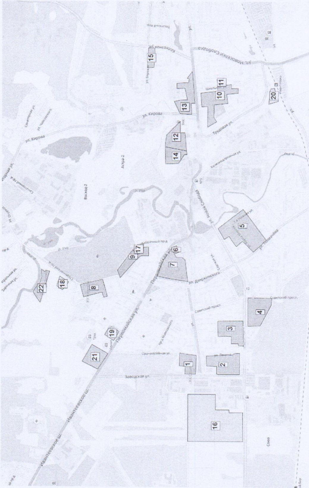
Зоны капитального строительства с указанием номера объекта в соответствии с обозначениями принятыми в таблице 1.3.3.